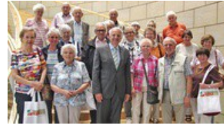
Altenberger Seniorenkreis zu Besuch im Landtag