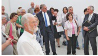
Kulturverein Burscheid: KulTour - Politik trifft Kunst