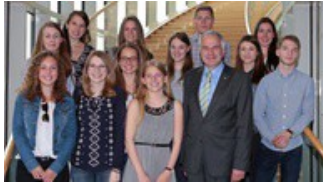
Beste Abiturienten zu Besuch im Landtag