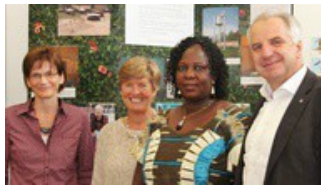
Grundschule Odenthal-Eikamp unterstützt Waisenhaus in Burkina Faso