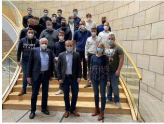
Junge Union RBK im Landtag