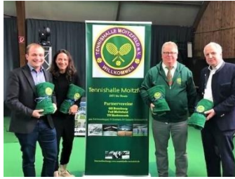
Moitzfeld's Tennishalle ist wieder modern und in Betrieb