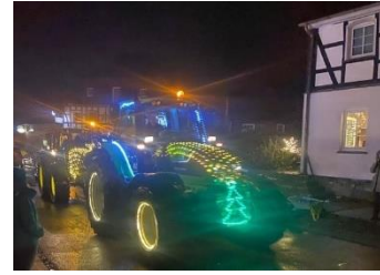
Weihnachtliche Lichter durch Landwirte